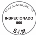
Modelo 5: 15cm de LADO