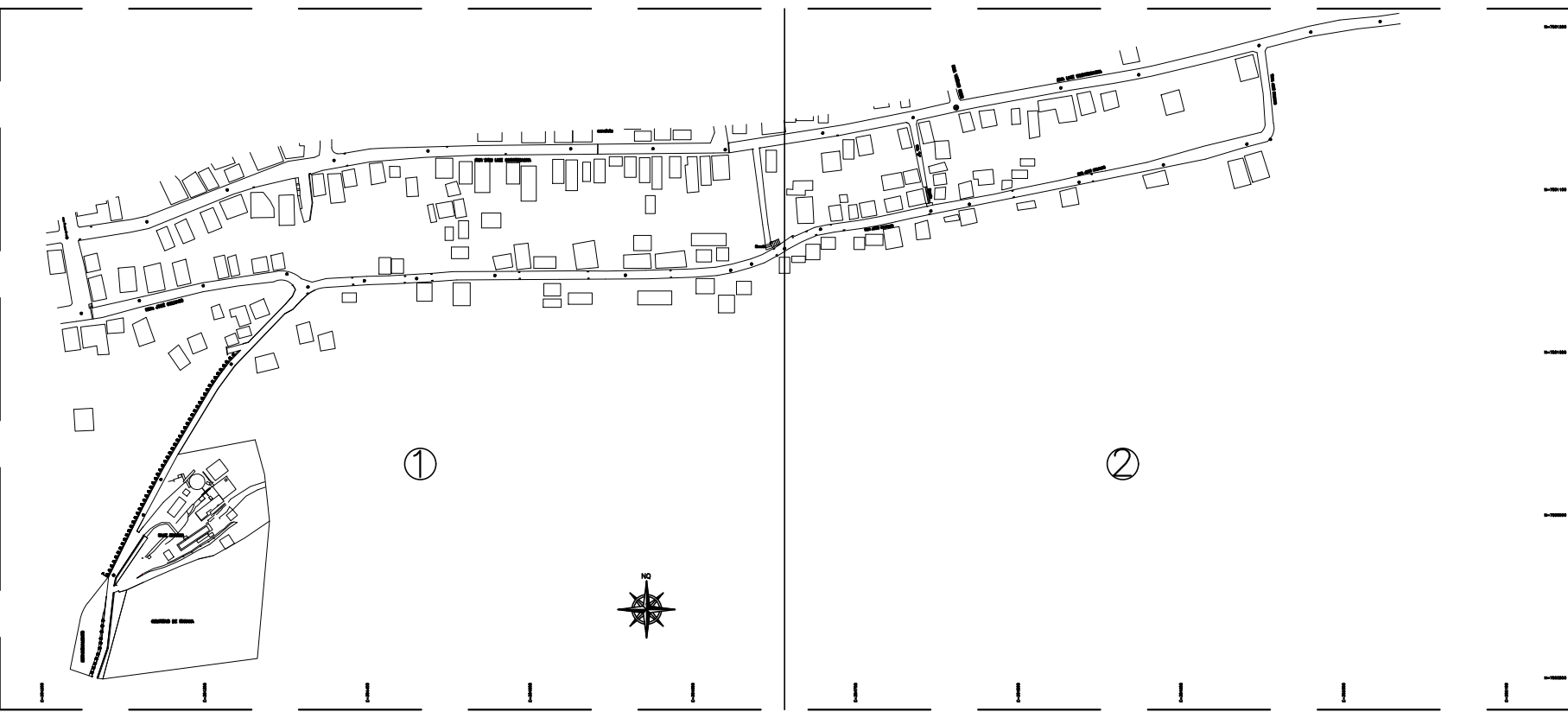
ARTICULAÇÃO DAS PLANCHAS ESC.: 1/4000