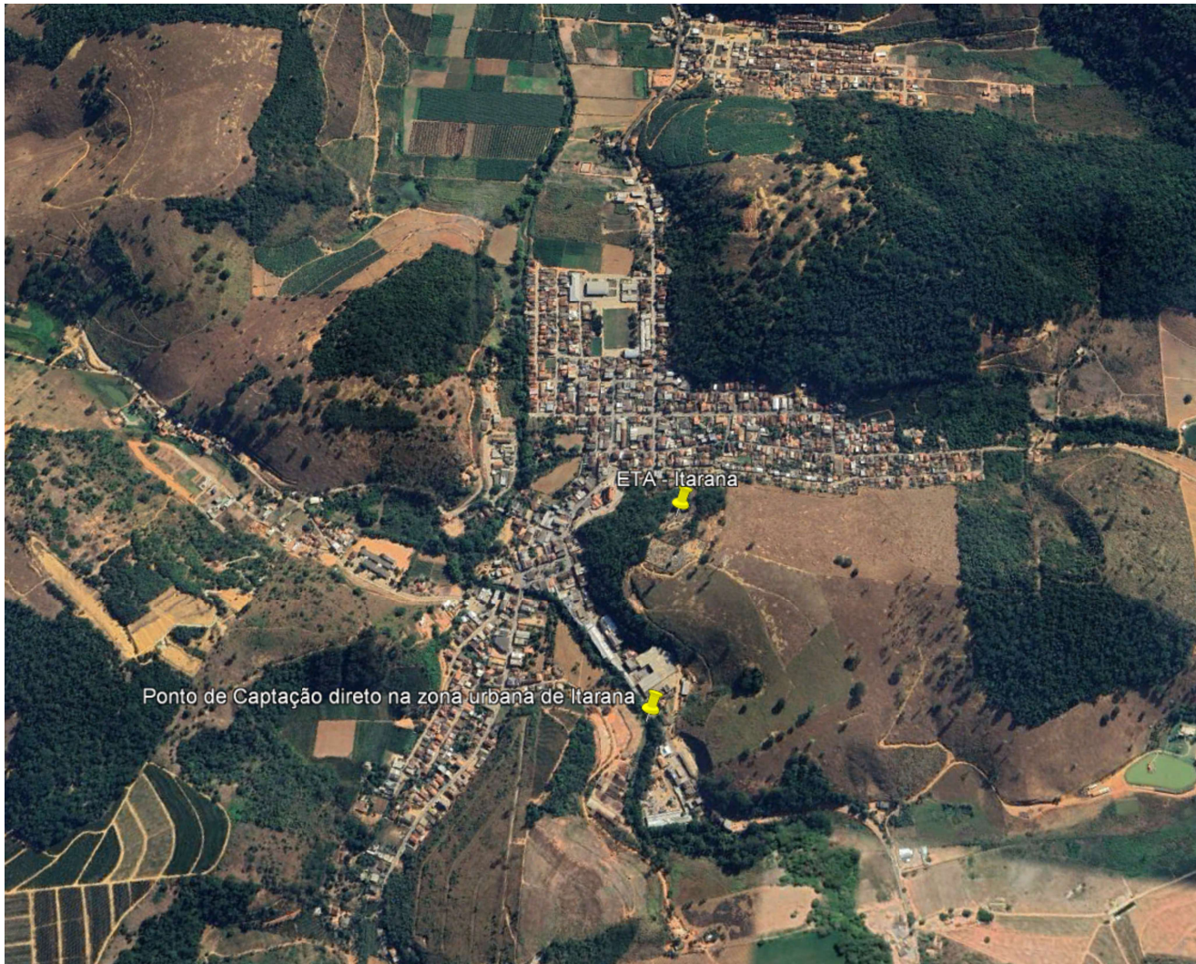
Imagem 3: No detalhe a zona urbana de Itarana, contendo a localização da ETA – Estação de Tratamento de Água da cidade, também o ponto de captação de água na zona urbana municipal.