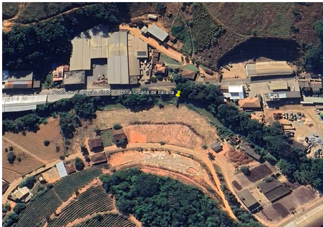
Imagem 2: Ponto de captação de água para abastecimento, na zona urbana.