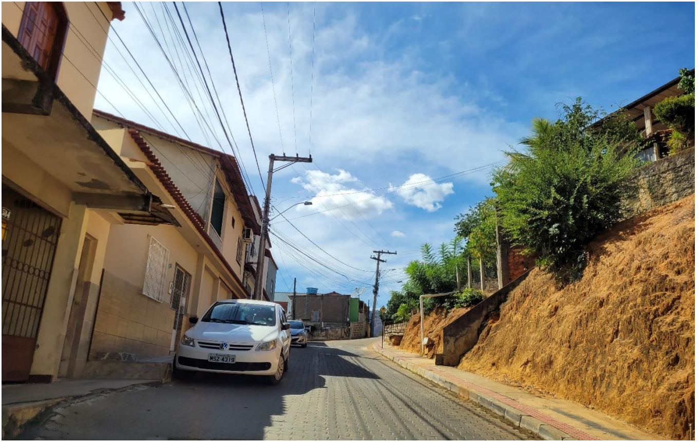
Rua José Colnago