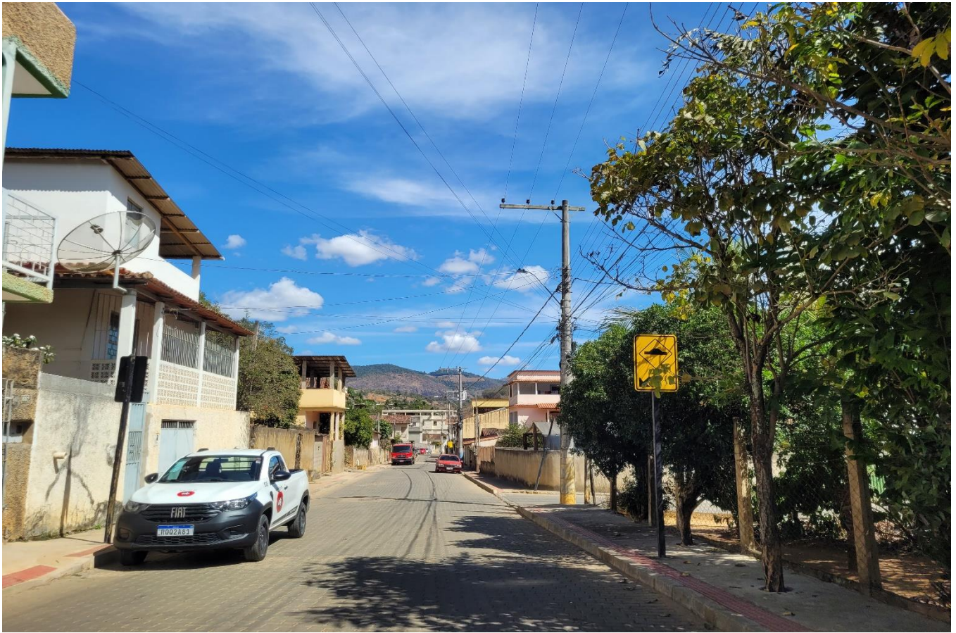
Rua Dom Luiz Scortegagna