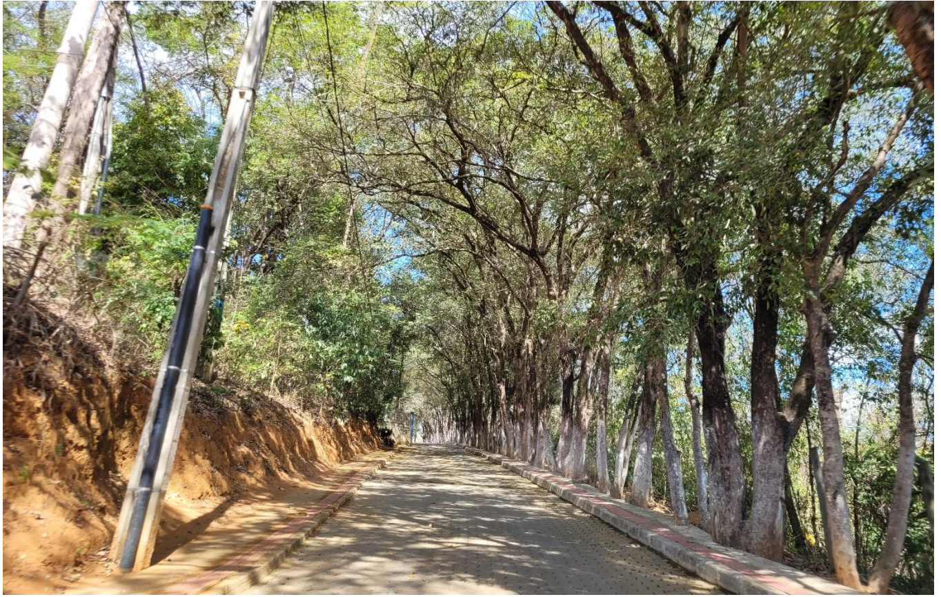
Alameda Antônio Ferreira de Jesus