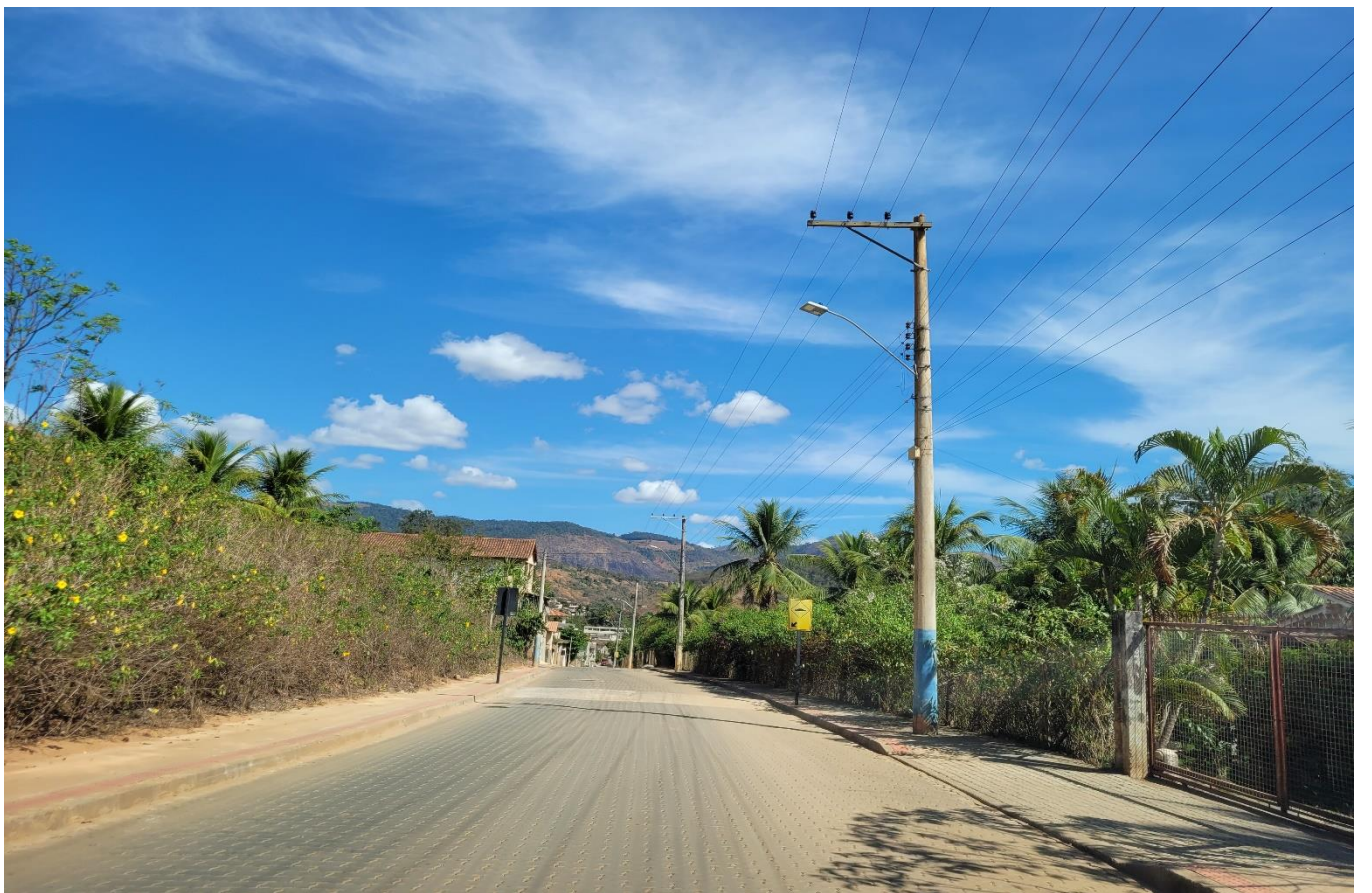
Rua Dom Luiz Scortegagna