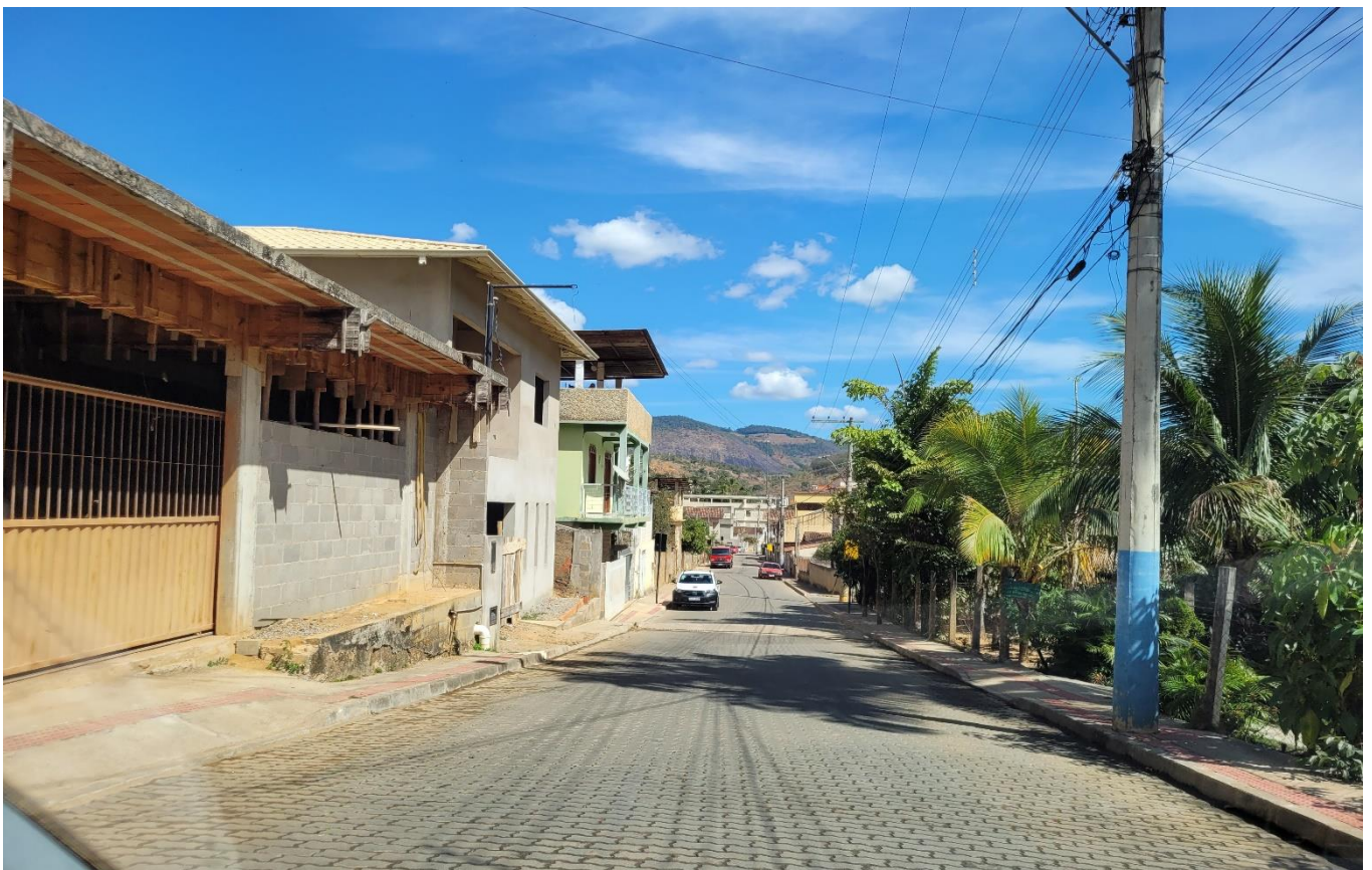
Rua Dom Luiz Scortegagna