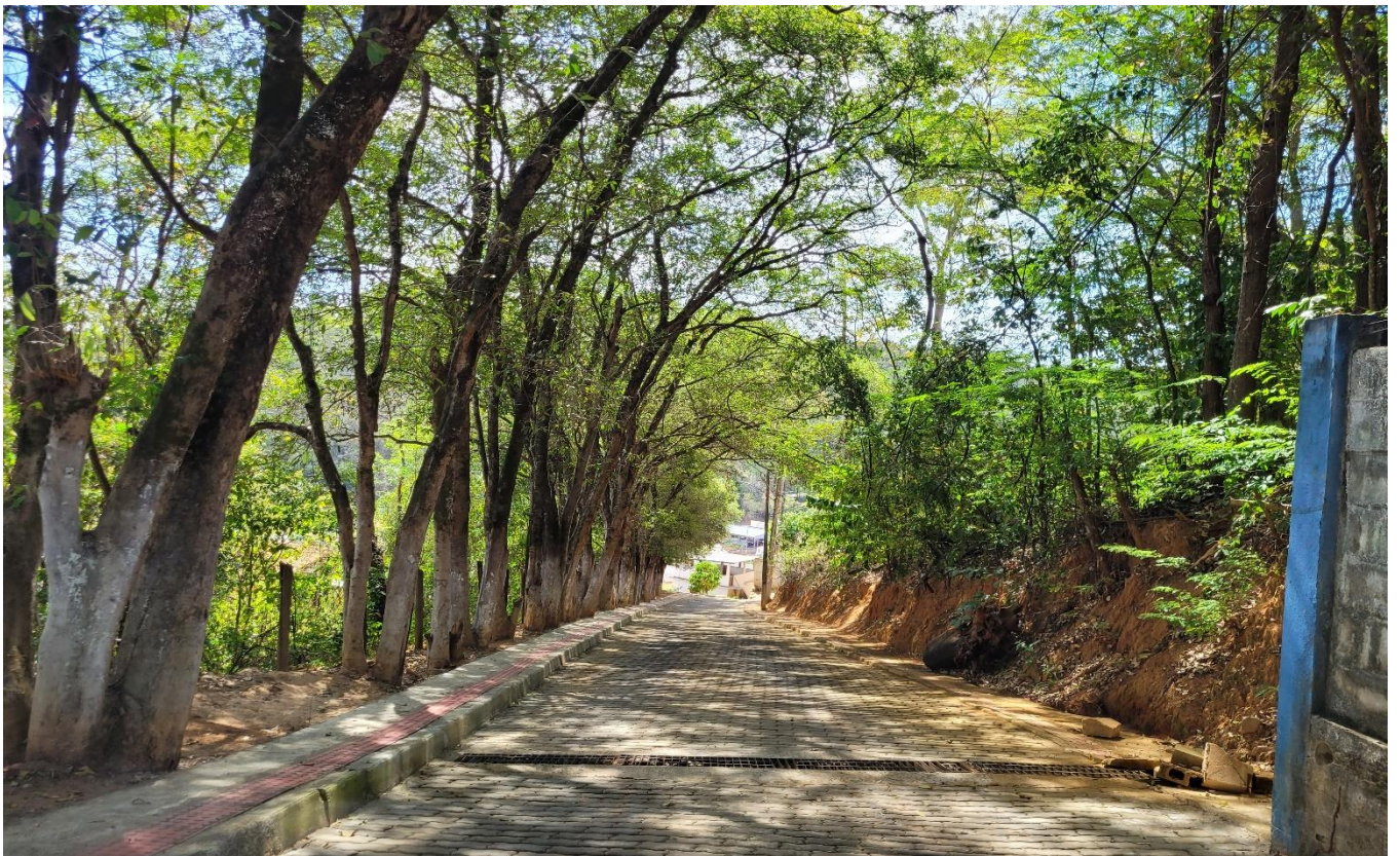
Alameda Antônio Ferreira de Jesus