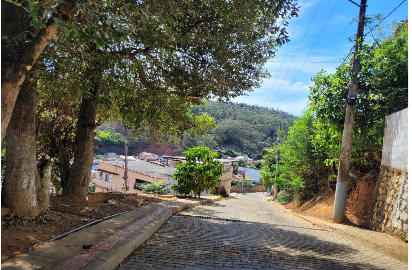
Alameda Antônio Ferreira de Jesus