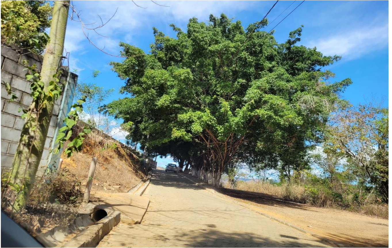
Alameda Antônio Ferreira de Jesus