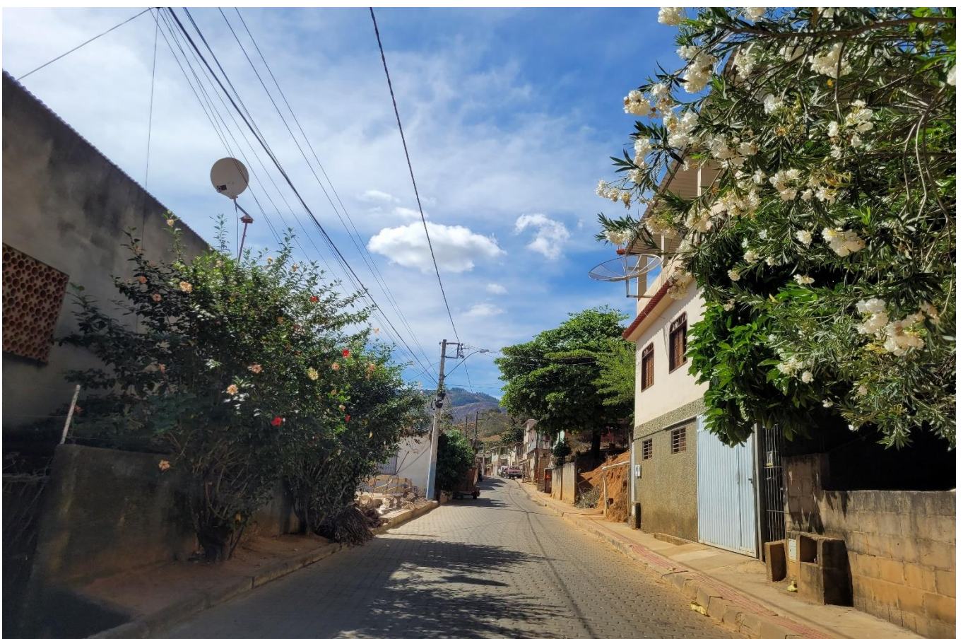
Rua José Colnago