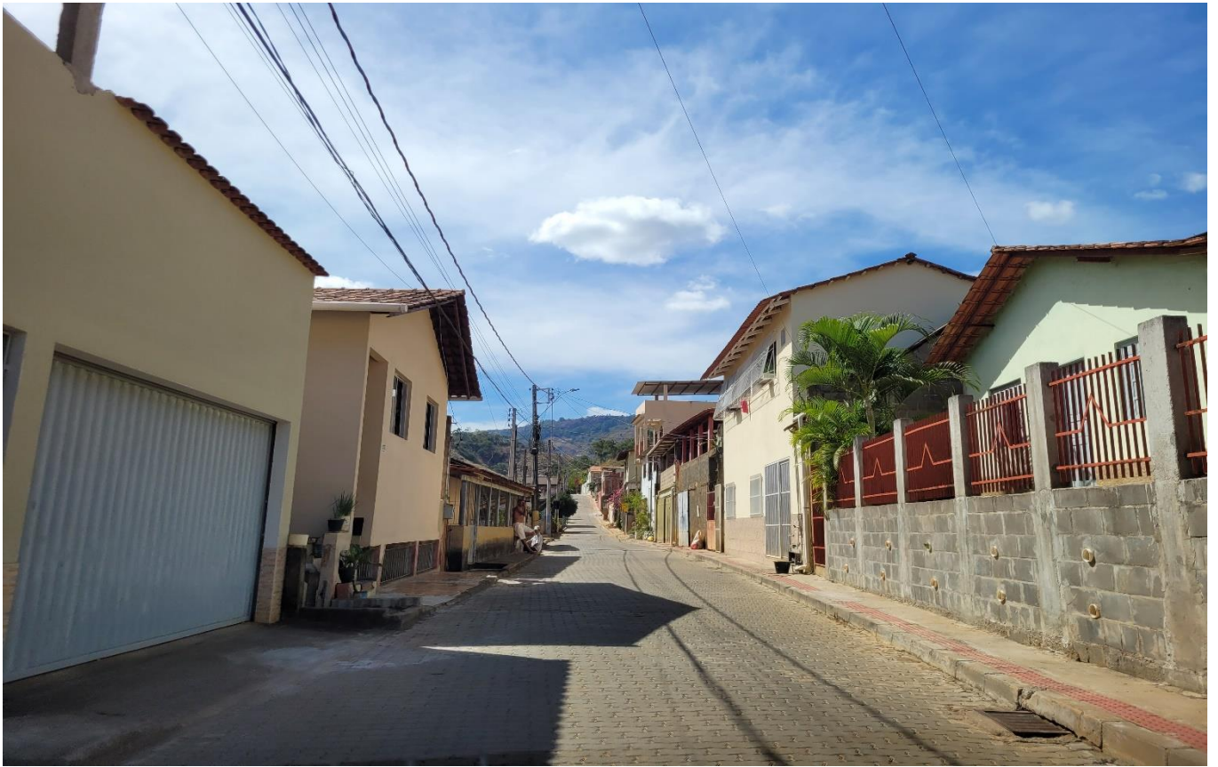
Rua José Colnago