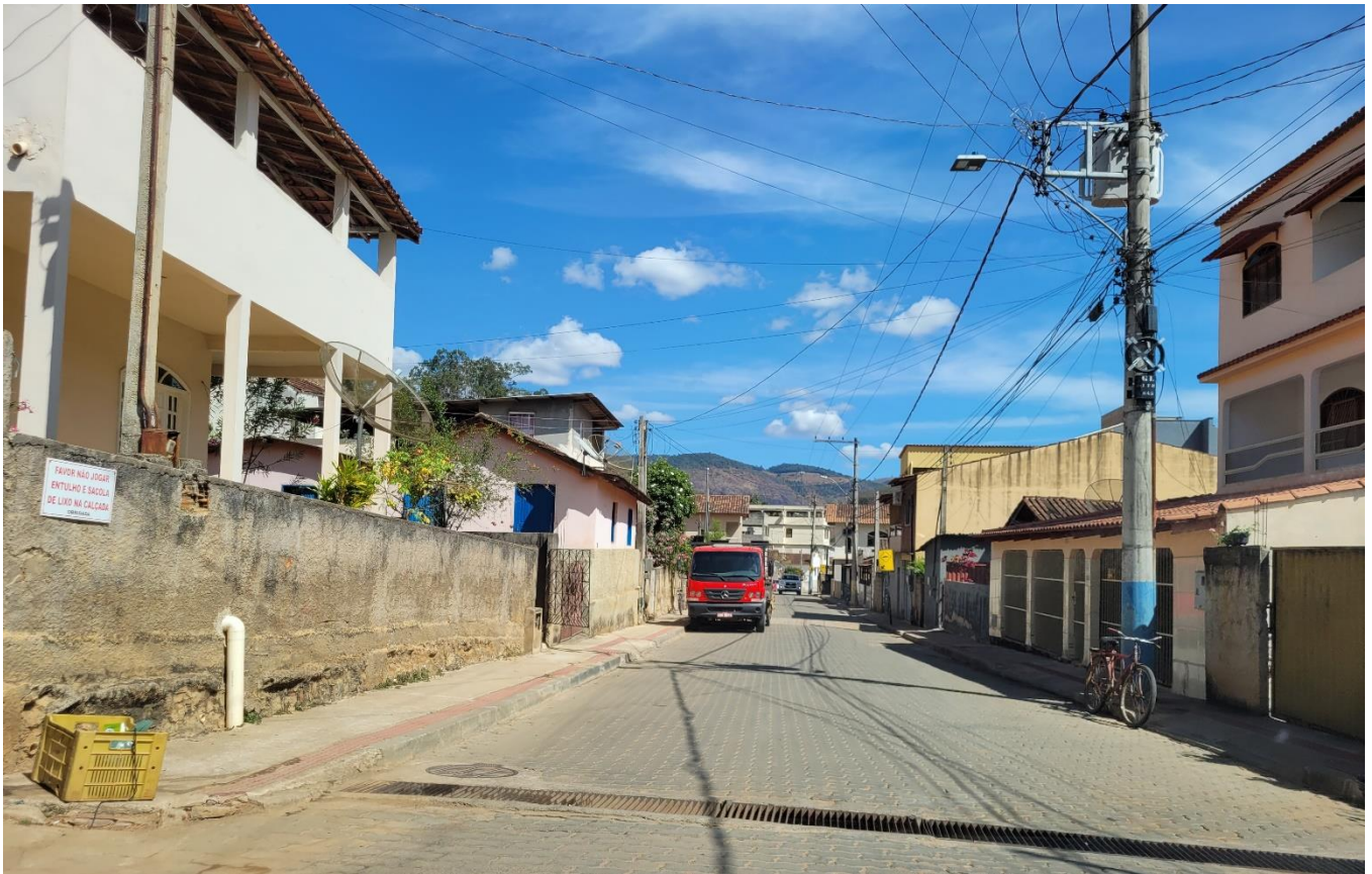
Rua Dom Luiz Scortegagna

Edifício Ames Rua Alberto de Oliveira Santos, 42, 20º e 21º andar, Centro, Vitória- CEP 29.010-901 Gestão de Convênios - Tel.: 3636-5004