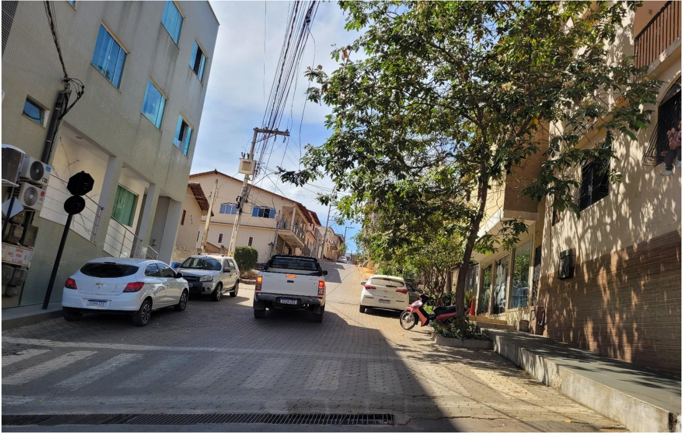
Rua José Colnago