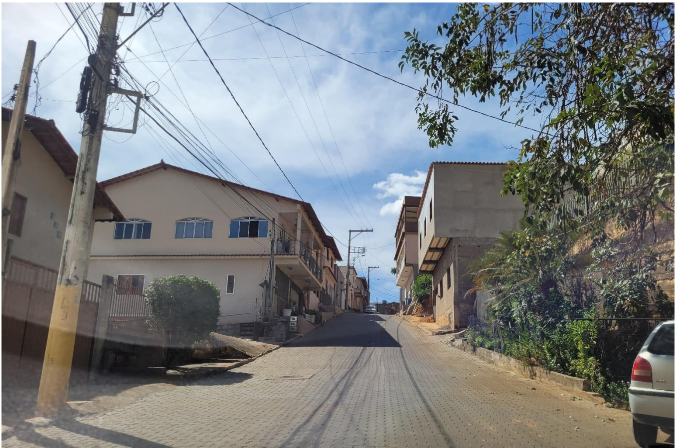
Rua José Colnago