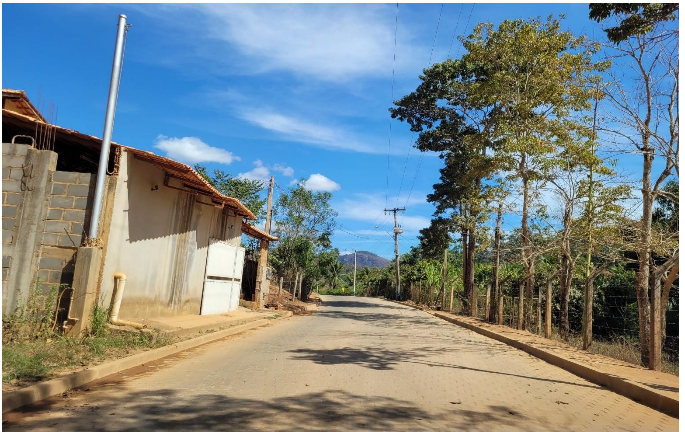
Rua Dom Luiz Scortegagna