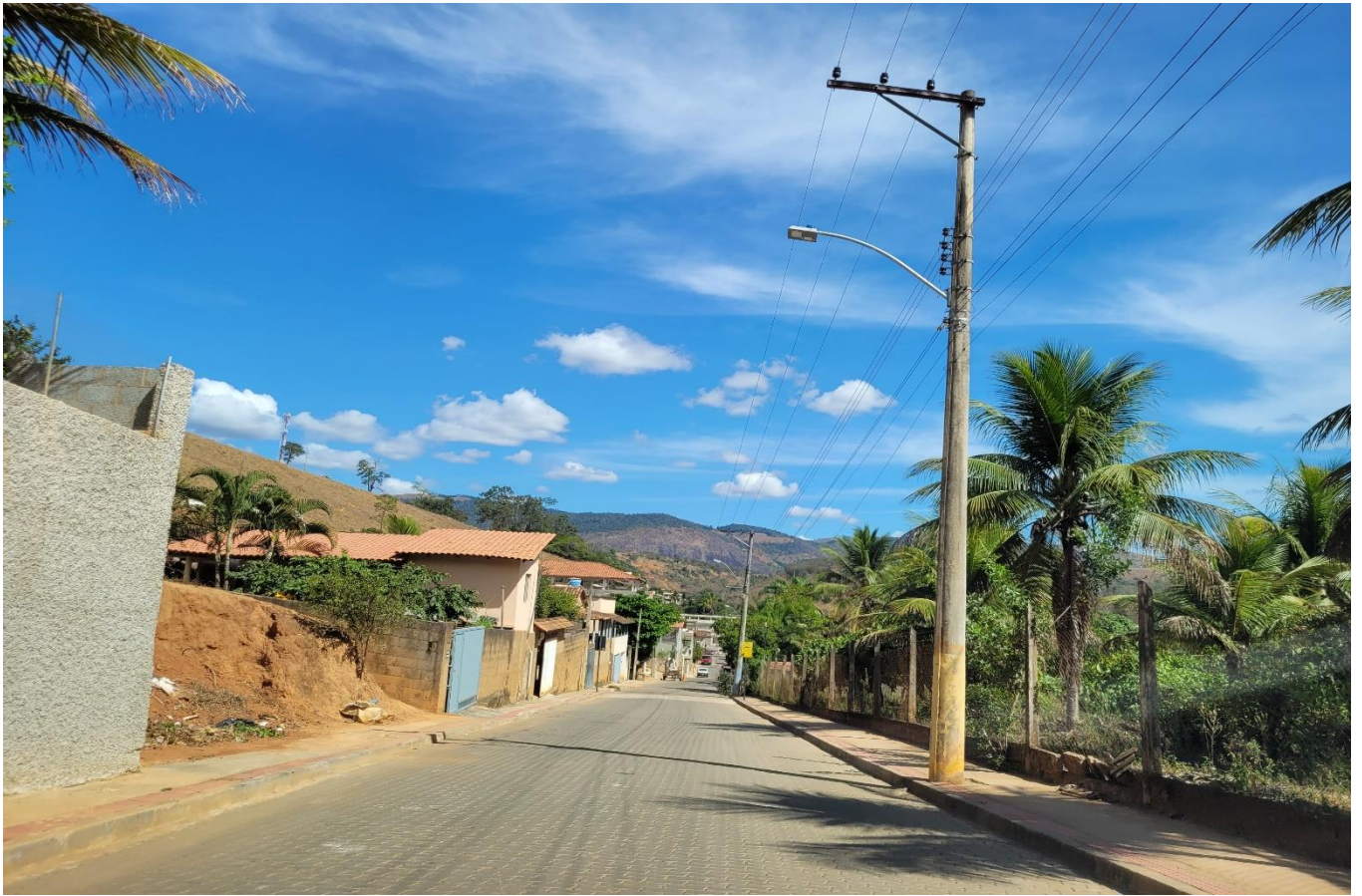
Rua Dom Luiz Scortegagna