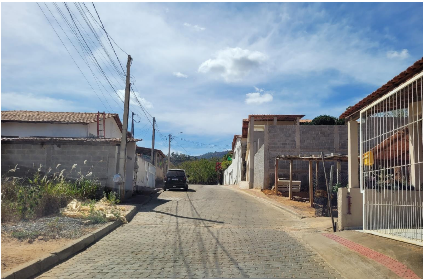
Rua José Colnago