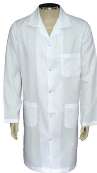
Jaleco unissex, manga longa.