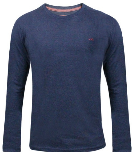
Camisa em malha, manga longa.