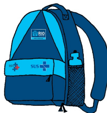
Bolsa para Agentes Comunitários de Saúde