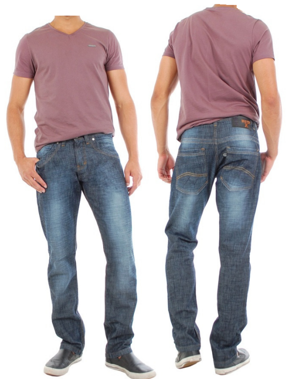
Calça jeans masculina.