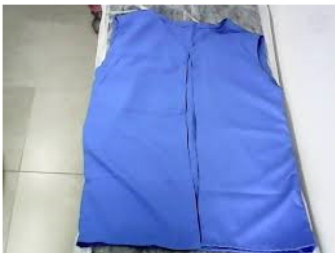
Camisola para exame ginecológico.