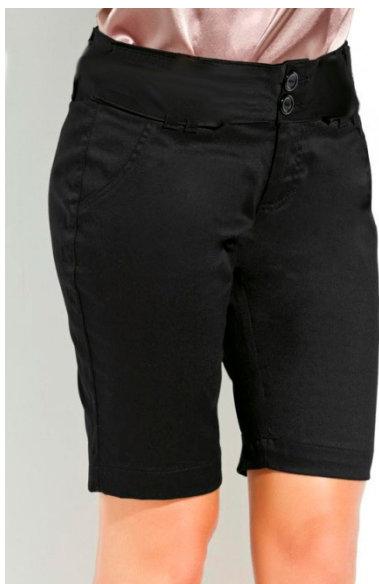
Bermuda social feminina. (Agentes Comunitários de Saúde).