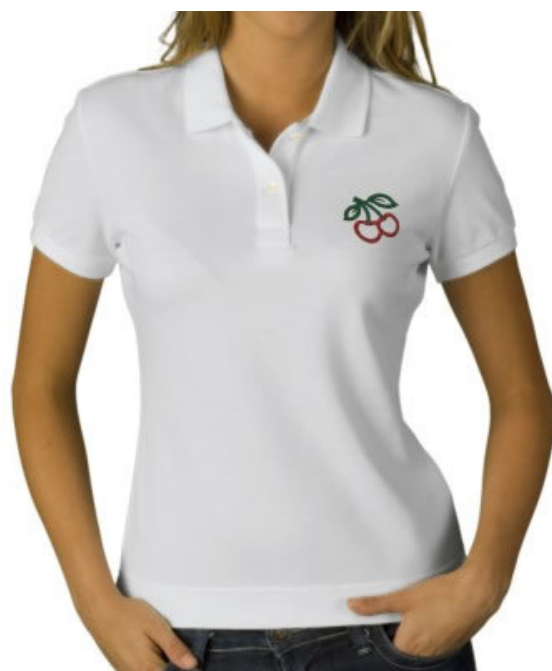
Camiseta feminina com manga. (Agentes Comunitários de Saúde).