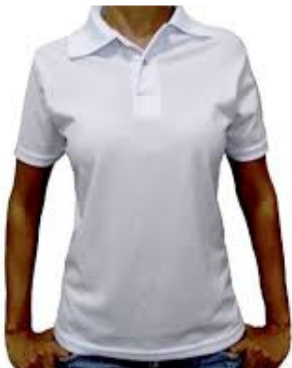
Camisa feminina gola pólo.