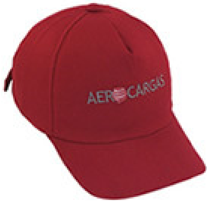
Boné com forro. (parte frontal)