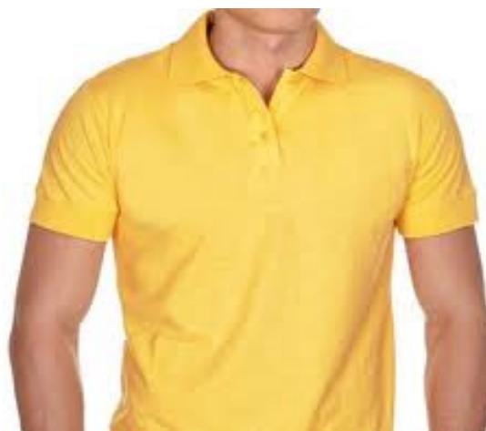
Camisa masculina, gola pólo.