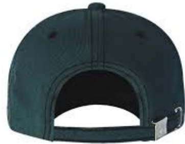
Boné com forro. (parte traseira)