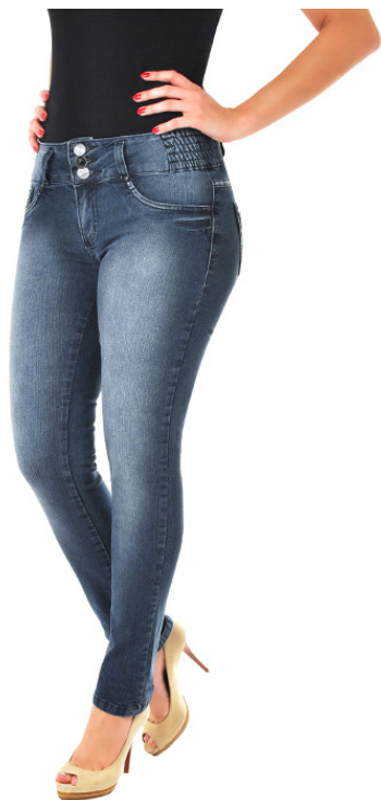
Calça Jeans feminina.