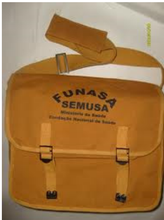
Bolsa de lona padrão FUNASA.