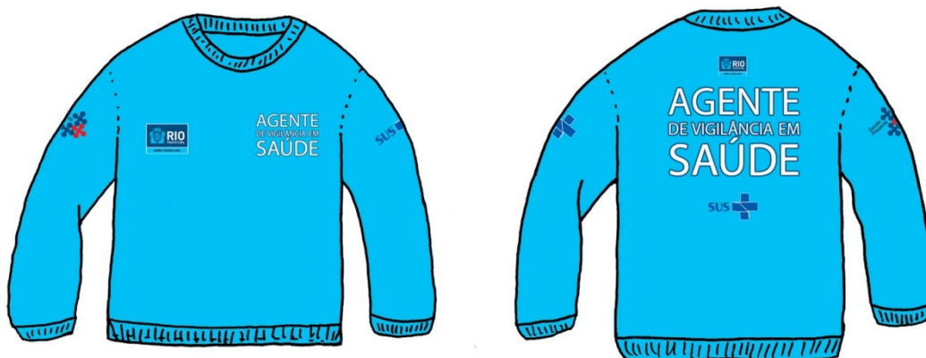
Casaco de frio feminino com fechiclér. (Agentes Comunitários de Saúde).